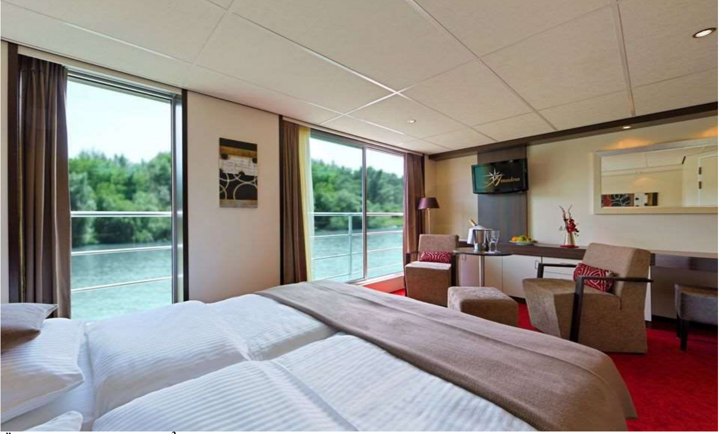
Üst Kat Suite Kabin - 22 m 2