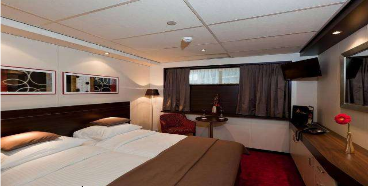
Alt Kat Dış Kabin - 15 m 2