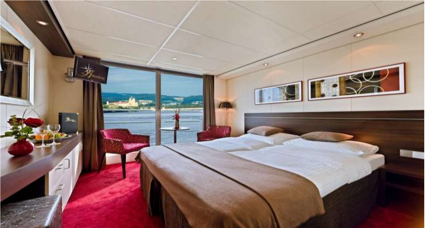
Orta ve Üst Kat French Kabin - 15 m 2