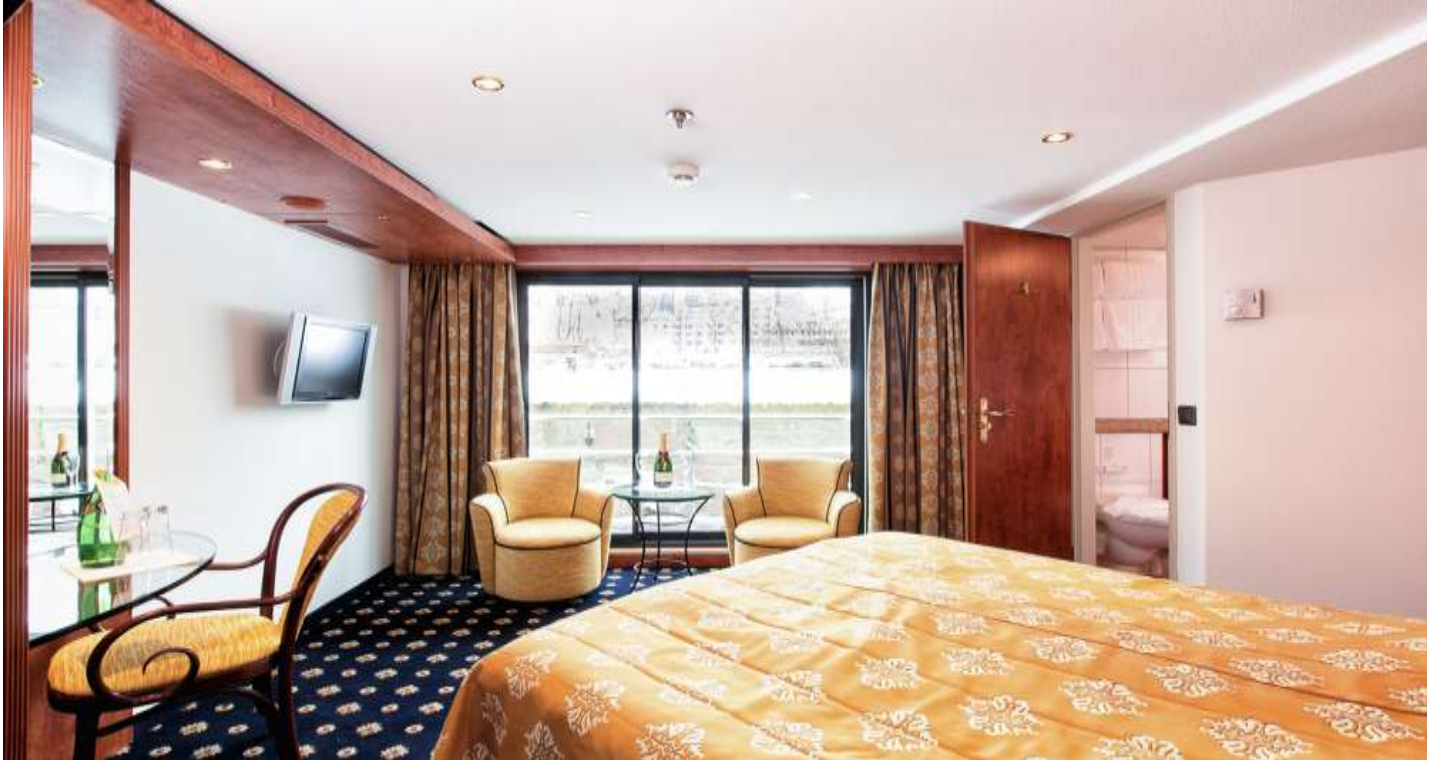
ORTA VE ÜST KAT MİNİ SUİTE KABİN (2.ve 3.Kat 19 m2 )

2005 yılında seferlerine başlayan geminin uzunluğu 110m, genişliği 11,40m, yüksekliği 6 metre ve toplam 3 katlı olan gemide 76 kabin bulunmaktadır ve yolcu kapasitesi 153 olarak belirlenmiştir. Dış ve French Balkonlu kabinler 15 m2 , Mini Suit kabinler 19 m2 büyüklüğündedir. Tüm kabinlerde; klima, Tv, telefon, minibar, kasa, saç kurutma makinası, kıyafet askısı, havlu, şampuan gibi imkanlar mevcuttur. (Suite kabinler haricindeki kabinlerde Terlik ve Bornoz bulunmamaktadır).