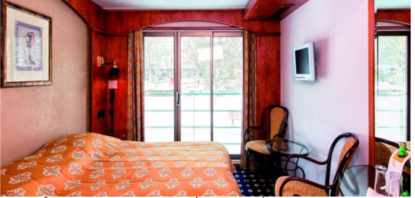
ORTA VE ÜST KAT FRENCH BALKONLU KABİN (2.ve 3.Kat 15 m2 )