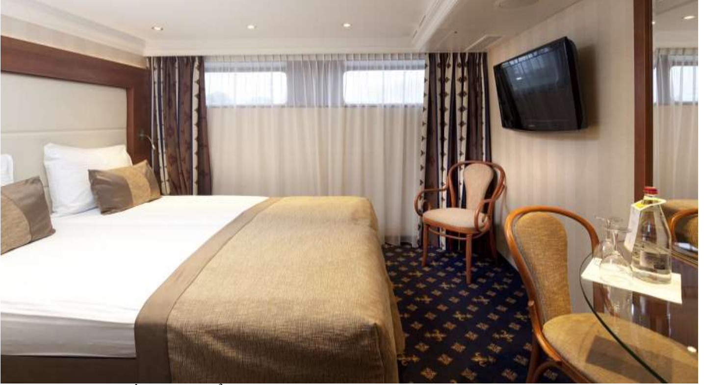
ALT KAT DIŐ KABİN (1.Kat 15 m2 )