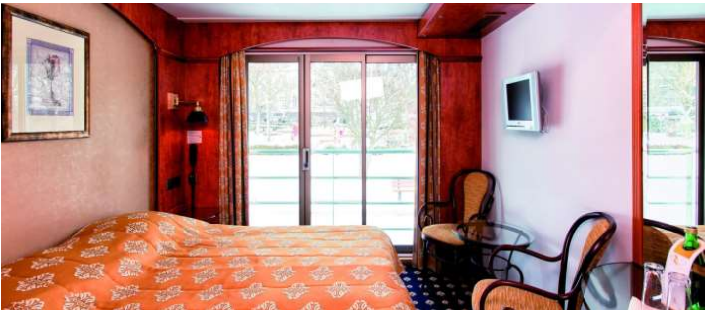
ORTA VE ÜST KAT FRENCH BALKONLU KABİN (2.ve 3.Kat 15 m2 )

Merkez : Halaskargazi Caddesi Şenkal Apartmanı No:37 Kat 1 Harbiye İstanbul / Turkey