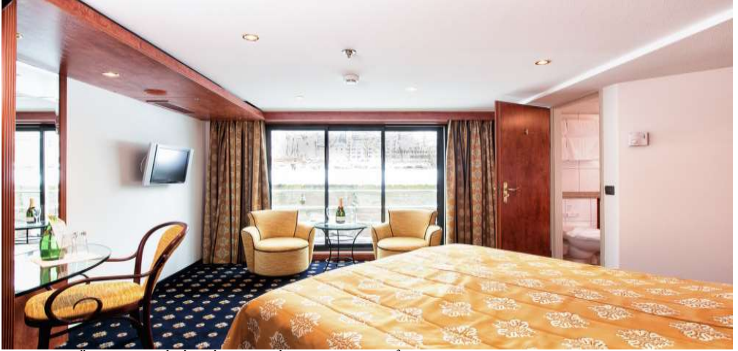
ORTA VE ÜST KAT MİNİ SUİTE KABİN (2.ve 3.Kat 19 m2 )

2005 yılında seferlerine başlayan 2015 de tamamen yenilenen geminin uzunluğu 110m, genişliği 11,40m, yüksekliği 6 metre ve toplam 3 katlı olan gemide 76 kabin bulunmaktadır ve yolcu kapasitesi 153 olarak belirlenmiştir. Dış ve French Balkonlu kabinler 15 m2 , Mini Suit kabinler 19 m2 büyüklüğündedir. Tüm kabinlerde; klima, Tv, telefon, minibar, kasa, saç kurutma makinası, kıyafet askısı, havlu, şampuan gibi imkanlar mevcuttur. (Suite kabinler haricindeki kabinlerde Terlik ve Bornoz bulunmamaktadır).