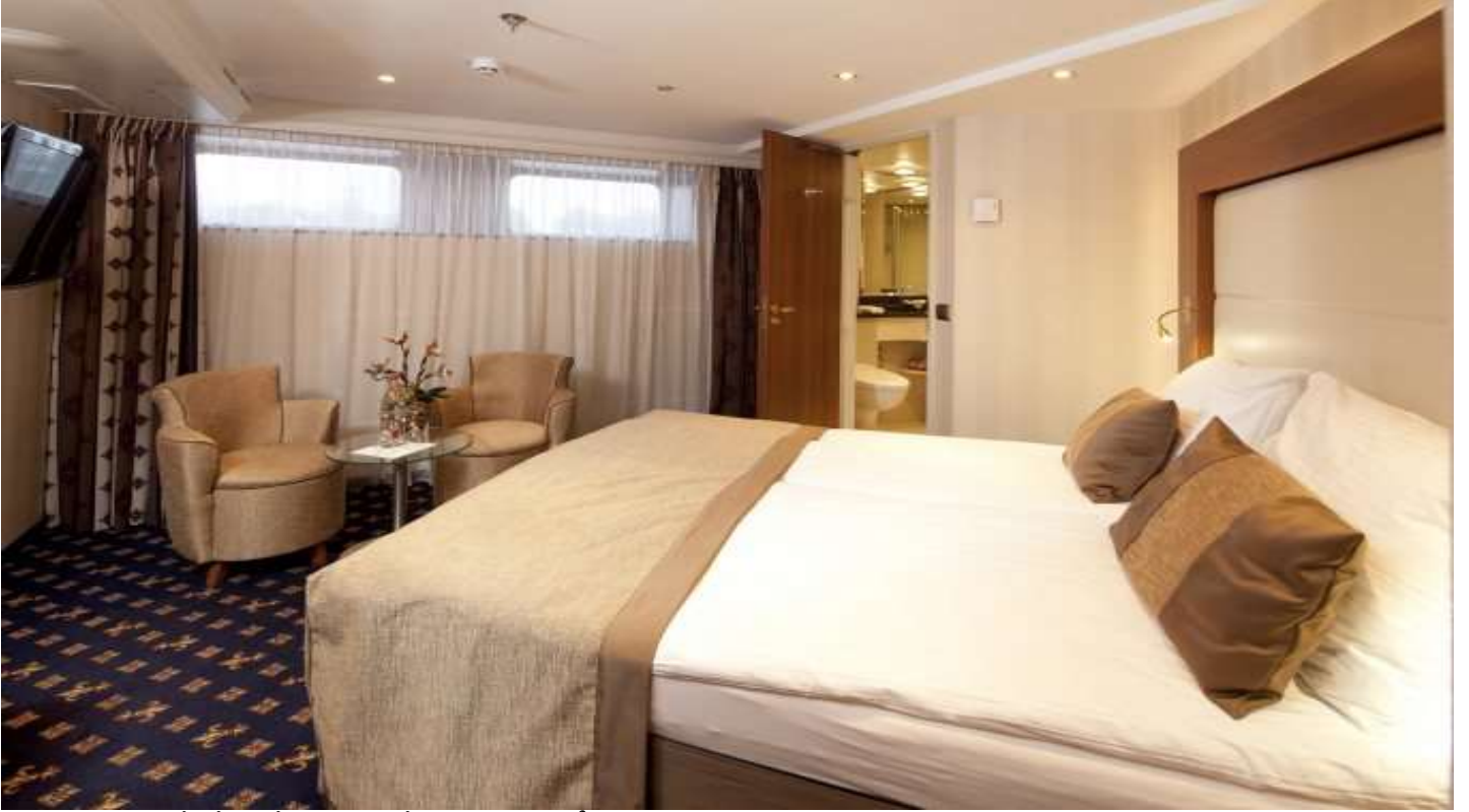
ALT KAT MİNİ SUİTE KABİN (1.Kat 19 m ²)